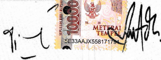
DADANG ARY AVIANTO PEMIMPIN CABANG BANYUWANGI